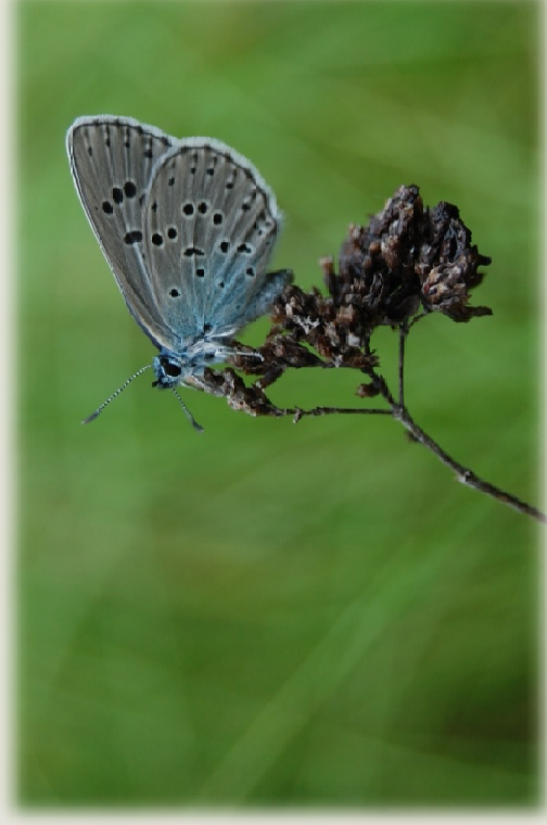
Azuré du Serpolet

Réunion d'information Lioujas - 14 Avril 2015